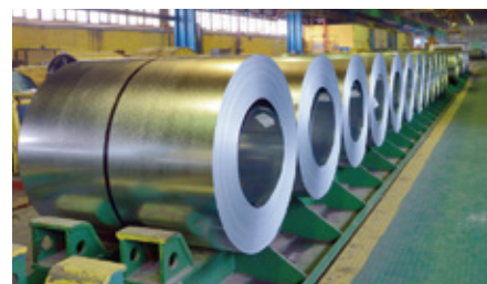
溶融亜鉛メッキコイル