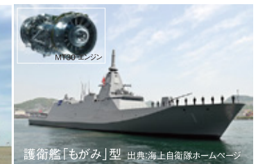
護衛艦「もがみ」型