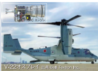
V-22オスプレイ