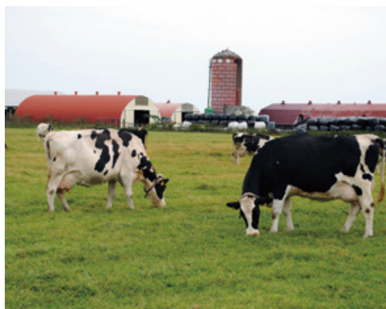
食品生産の副産物から養牛飼料に

現在、国内は北海道から九州まで専従のスタッフを配し、お得意先様のニーズを的確にとらえ活動しています。