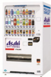
提携自販機 スターダイヤ

当社は、日本でのカップ式コーヒー自販機のスタート段階から携わり、自販機業界の発展と共に歩んできました。いつでも、どこでも、だれでも…、人の集まる所につろぎとやすらぎの空間を清涼飲料メーカーと自販機オペレーター（管理運営会社）と連携しながら全国規模で展開してきました。とりわけ時代や社会の変化、そしてニーズに応じた、売れ筋商品搭載の提携自販機「スターダイヤ」を業界に先駆け1987年に企画・投入するなど、常に自販機ビジネスをリードする総合的な取り組みを行ってきました。