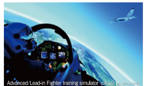
Advanced/Lead-in Fighter training simulator

ボーイング737やエアバスA320といった旅客機の貨物搭載システムを供給しています。航空機での貨物積み降ろし作業を効率化することで、費用削減のみならずグラウンドハンドリングクルーの重労働環境の改善に寄与しています。地上倉庫において同様に貨物積み下ろしの効率化と作業員への負担軽減に貢献しています。