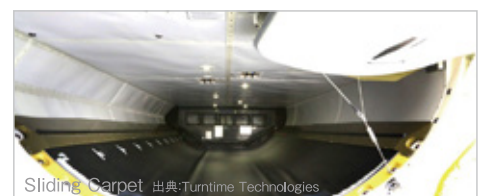
Sliding Carpet