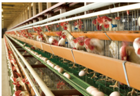
鶏卵生産業界にも飼料を供給

“世界中の限られた資源をいかに効率良く利用できるか”、“どうしたら、もっと良い餌飼料・ペットフードができるのか”。そのようなテーマで取り組んでいます。