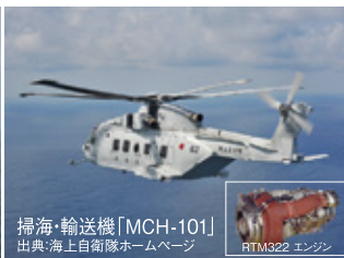
掃海・輸送機「MCH-101」